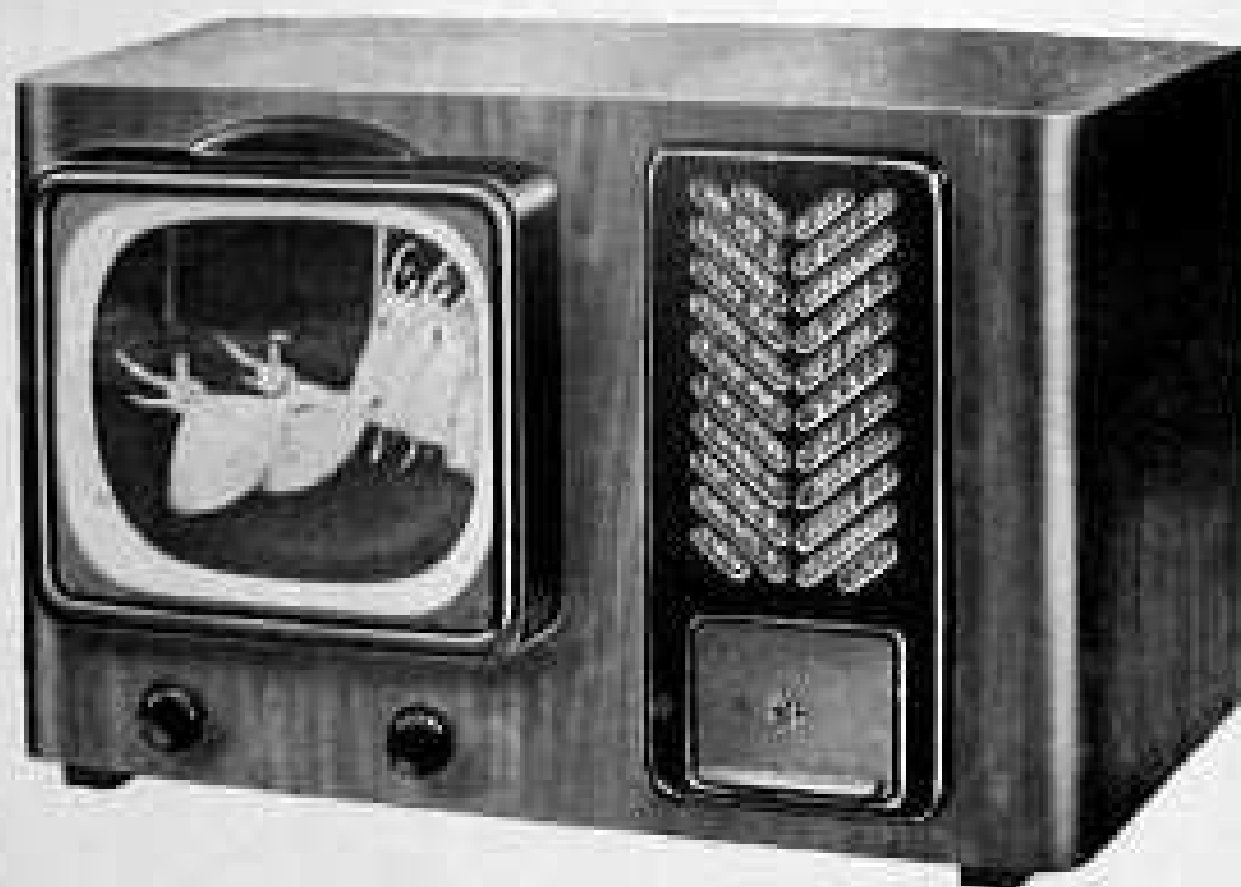
Récepteur de table PYE pour vision directe avec lequel furent faites les expériences de Blonkenbergho.